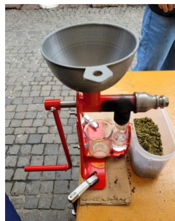
Colza, de la graine à l'huile

FRC Conseil | La permanence de la FRC Valais a fermé en 2020, les demandes de conseils et témoignages étant directement adressés au Bureau Conseil, à Lausanne ( coordonnées de contact ). En effet, les requêtes arrivées en direct à la permanence valaisanne ne justifiaient plus le maintien de cette prestation. Dès lors, ce sont les Experts conso et les juristes du Secrétariat central qui traitent les dossiers qui nécessitent des compétences juridiques toujours plus pointues.