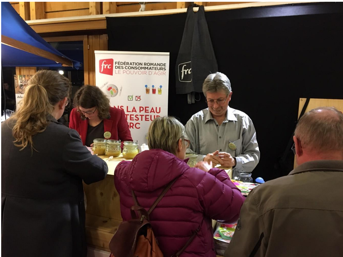
Salon Goûts et Terroirs à Bulle

A travers un test sur les compotes de pommes, les consommatrices et consommateurs ont réalisé que les pommes pouvaient être chinoise ou polonaise, sans que cela soit mentionné sur l'emballage.